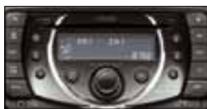
Radioodtwarzacz CD, MP3, USB, AUX