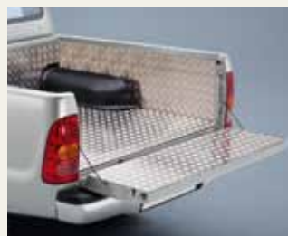
WYKŁADZINA ALUMINIOWA PRZESTRZENI ŁADUNKOWEJ