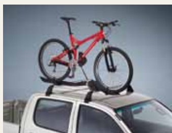
UCHWYT NA ROWER