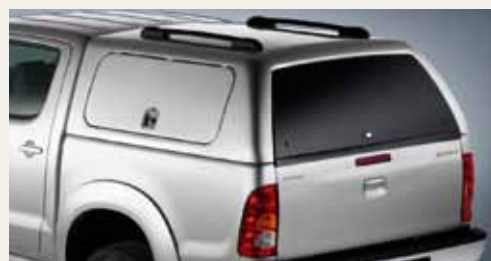
ZABUDOWA POLIESTROWA Z BOCZNYMI DRZWICZKAMI