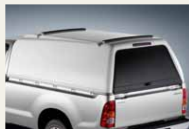
ZABUDOWA POLIESTROWA W WERSJI DOSTAWCZEJ