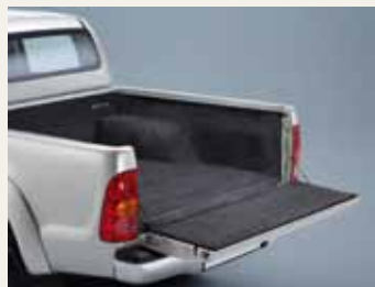
WYKŁADZINA WELUROWA PRZESTRZENI ŁADUNKOWEJ