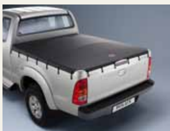
MIĘKKĄ OSŁONĄ PRZESTRZENI ŁADUNKOWEJ