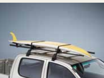
UCHWYT NA DESKĘ SURFINGOWĄ I MASZT