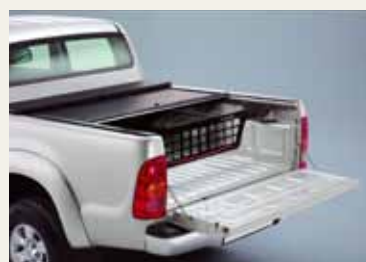
ROLETA Z OPCJONALNYM SYSTEMEM PODZIAŁU PRZESTRZENI ŁADUNKOWEJ