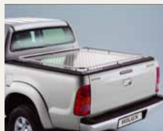
ALUMINIOWĄ OSŁONĄ PRZESTRZENI ŁADUNKOWEJ