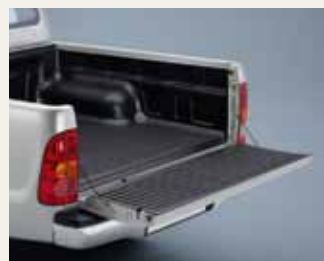
WYKŁADZINA PCV PRZESTRZENI ŁADUNKOWEJ