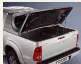
TWARDĄ OSŁONĄ PRZESTRZENI ŁADUNKOWEJ