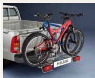
TYLNY UCHWYT NA ROWERY

Pełna oferta wyposażenia dodatkowego i akcesoriów dostępna jest w Autoryzowanej Stacji Dilerskiej. Podane rekomendowane ceny detaliczne brutto dotyczą następujących produktów: 1. Wykładzina (PCV) APZ4AD -PL700-3A; 2. Roleta elastyczna APZQ70-89140 & APZ438-N2181-00; 3. Zabudowa z bocznymi szybami DKUN-ARB-02-1C0; 4. Uchwyt na narty APZ4AF-ZM907-00. Ceny nie zawierają kosztów montażu.