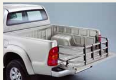
PRZEDŁUŻENIE PRZESTRZENI ŁADUNKOWEJ