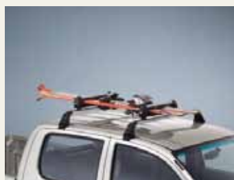
UCHWYT NA NARTY