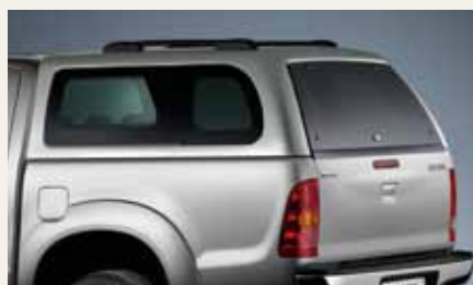
ZABUDOWA POLIESTROWA Z BOCZNYMI SZYBAMI