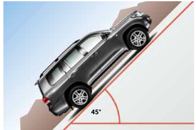
Zdolność pokonywania wzniesień 45°