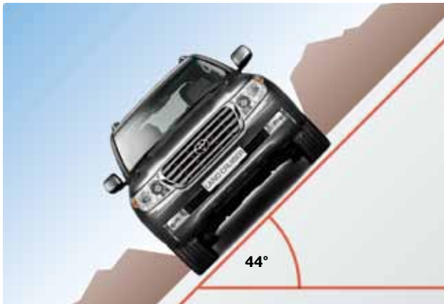
Maksymalny przechył boczny 44°