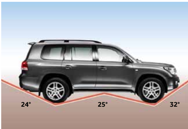
Kąt natarcia 32°, kąt zejścia 24° i kąt rampowy 25°